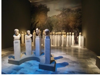
Εικ. 6. Άποψη της έκθεσης.